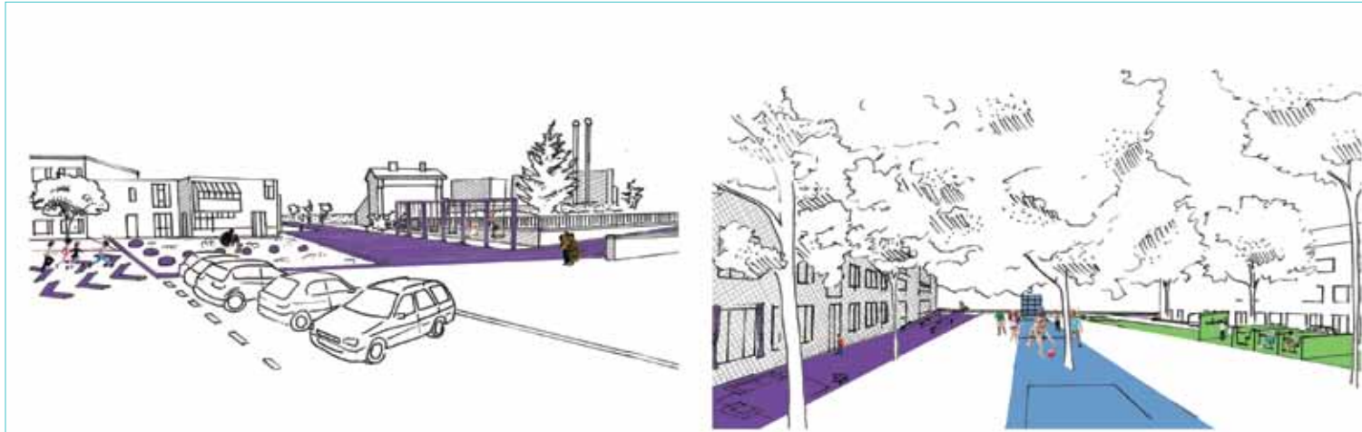
IMPRESSIE GASLAAN - SPEELROUTE

De speelplaats van de basisschool loopt grensloos over in de speelroute. Daardoor is er meer ruimte, maar is het ook mogelijk om buiten schooltijd hier te blijven spelen.